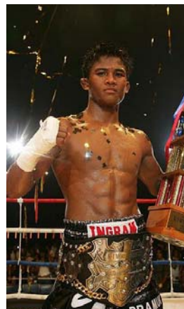
De la stânga la dreapta.

Malaipect-Team Diamond, Buakaw Por Pramuk – Campion k1 Max.